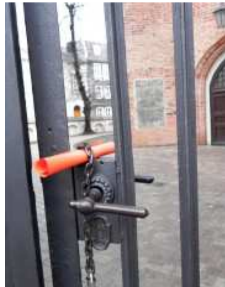
W bramie przed kościołem na Śródcie