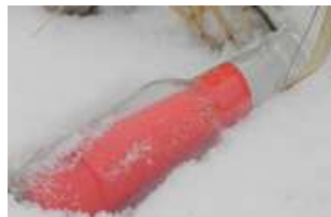
W butelce na brzegu Warty (oczywiście latem śniegu nie będzie)