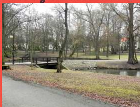
3. Przejść przez mostek