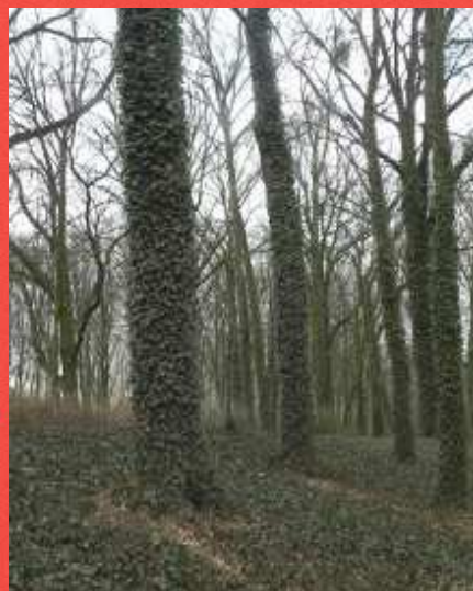
2. Drzewo ołamane gałąź