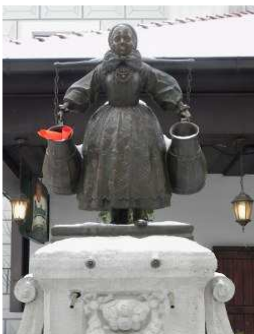
W dzbanie Bamberki