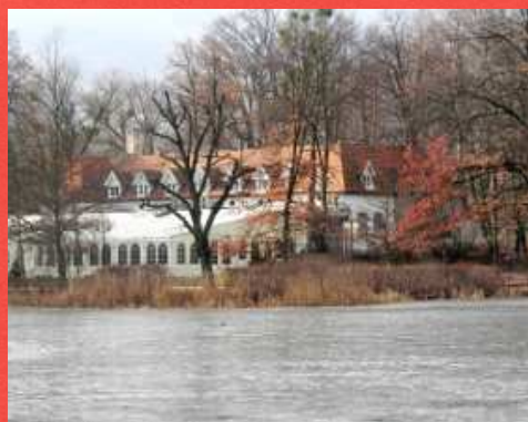
1. Biały hotel - restauracja

Dosyć śmiesznych rymów, dość wierszyków już Szukaj miejsc ze zdjęć, jesteś już tuż tuż