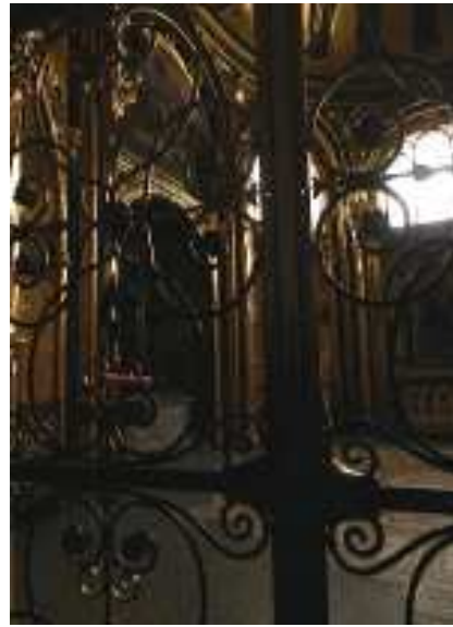
W Złotej kapliczce