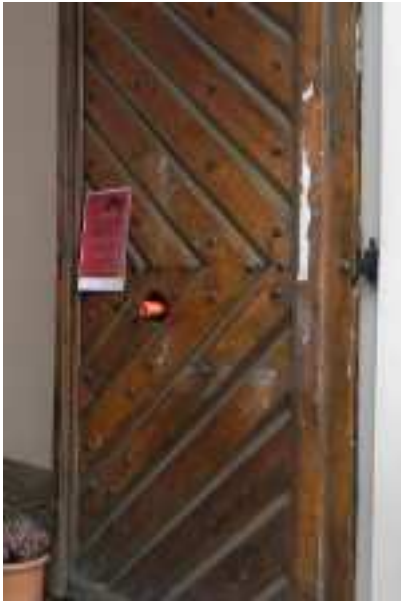
W drzwiach kawiarni "Cafe Misja"