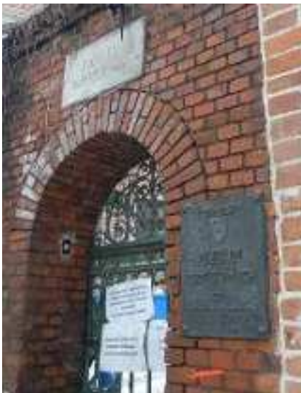
Przy Zamku Przemysława