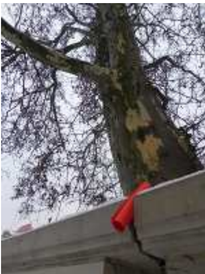
Na Placu Wolności z charakterystycznym platanem w tle