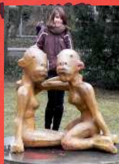
4. Rzeźba „Dwie kobiety” (i ja z ostatnim wersem)